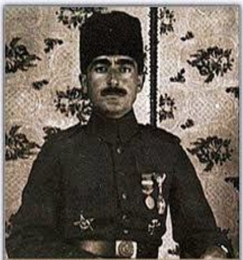
Halil (KUT) Paşa / 1882 - 1957